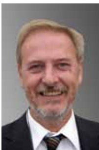
Prosper Lülsdorff Anlageinvestment Köln